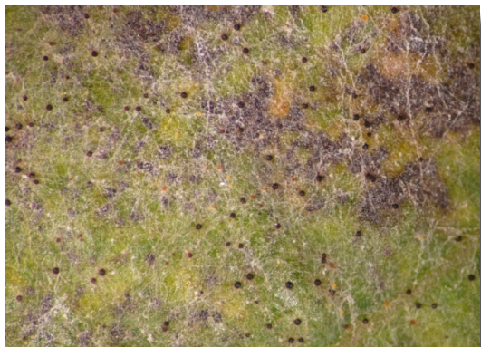
Fig. 1 Oidio su foglia - micelio e cleistoteci (ottobre)

Le precipitazioni della scorsa settimana possono aver dato luogo ad infezioni ascosporiche. Considerato l'attuale stadio fenologico si consiglia, nei casi in cui non sia già stato effettuato, di eseguire il primo trattamento antioidico, impiegando meptyl-dinocap, bupirimate, spiroxamina, zolfo bagnabile o in alternativa zolfo in polvere.